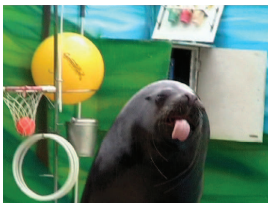
NATO PREDSTAVO MORSKEGA LEVA