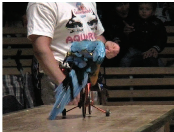
CIRKUŠKO PREDSTAVO S PAPIGAMI