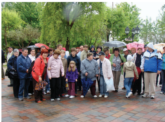
KO SMO PRIŠLI JE RAHLO DEŽEVALO