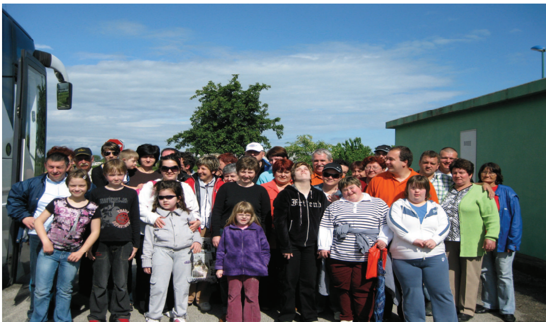
KO SMO ODHAJALI JE SIJALO SONCE