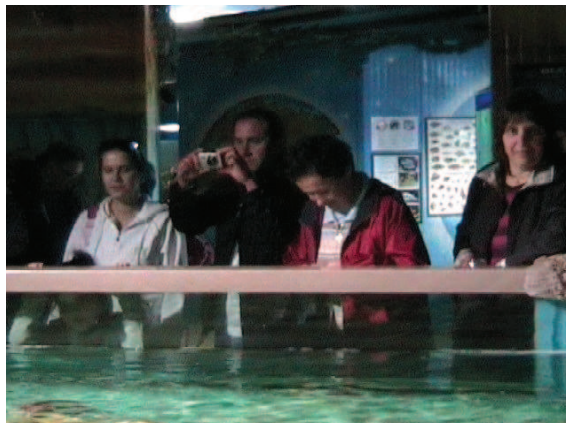
ZATO SMO SI NAJPREJ OGLEDALI AKVARIJ